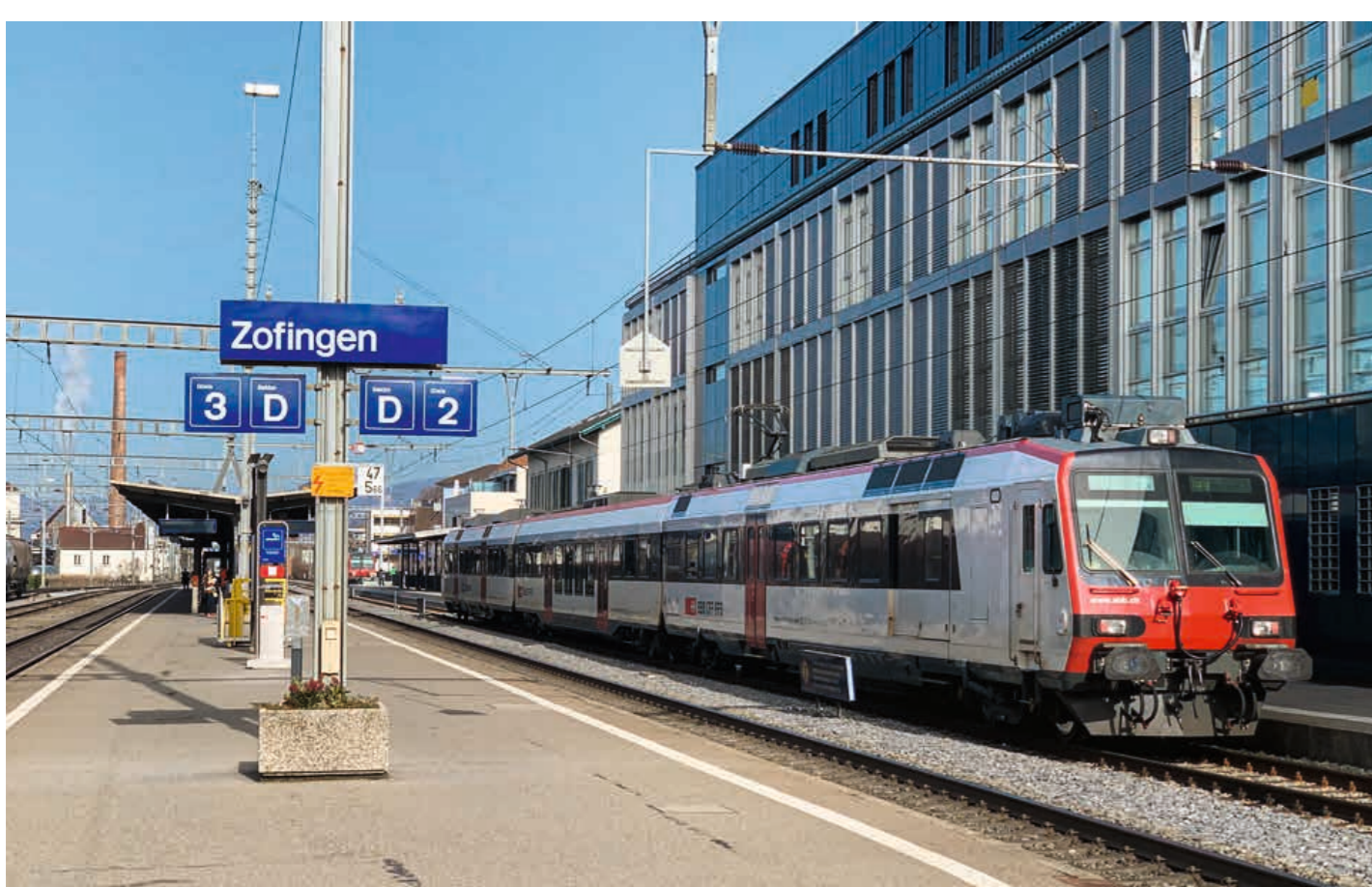
Bahnhof Zofingen vor dem Umbau