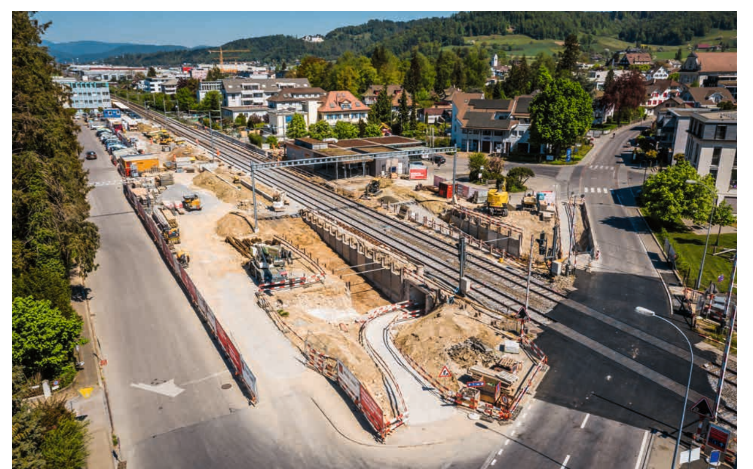
Reiden in Bauphase