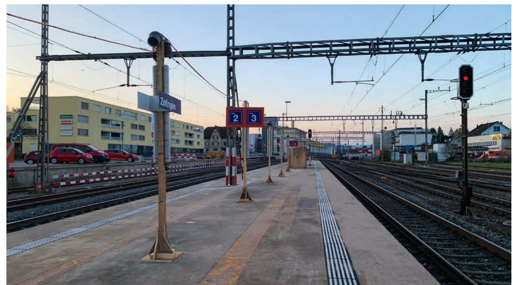
Provisorisches Perron Zofingen