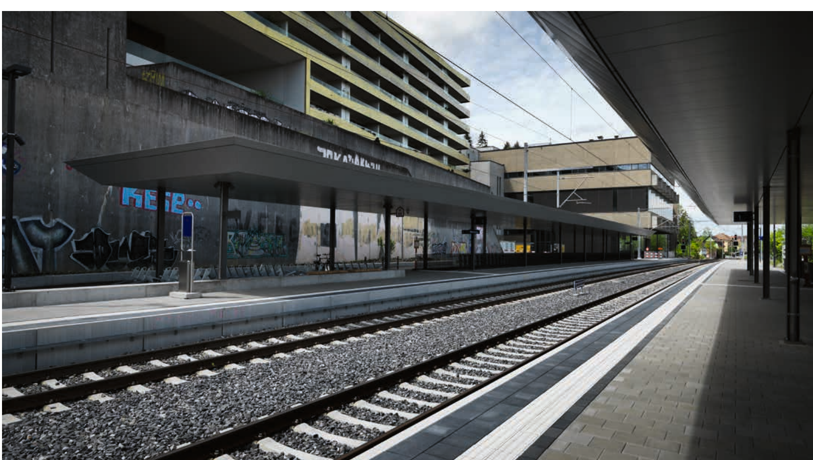
Blick Richtung Perron Bergseite