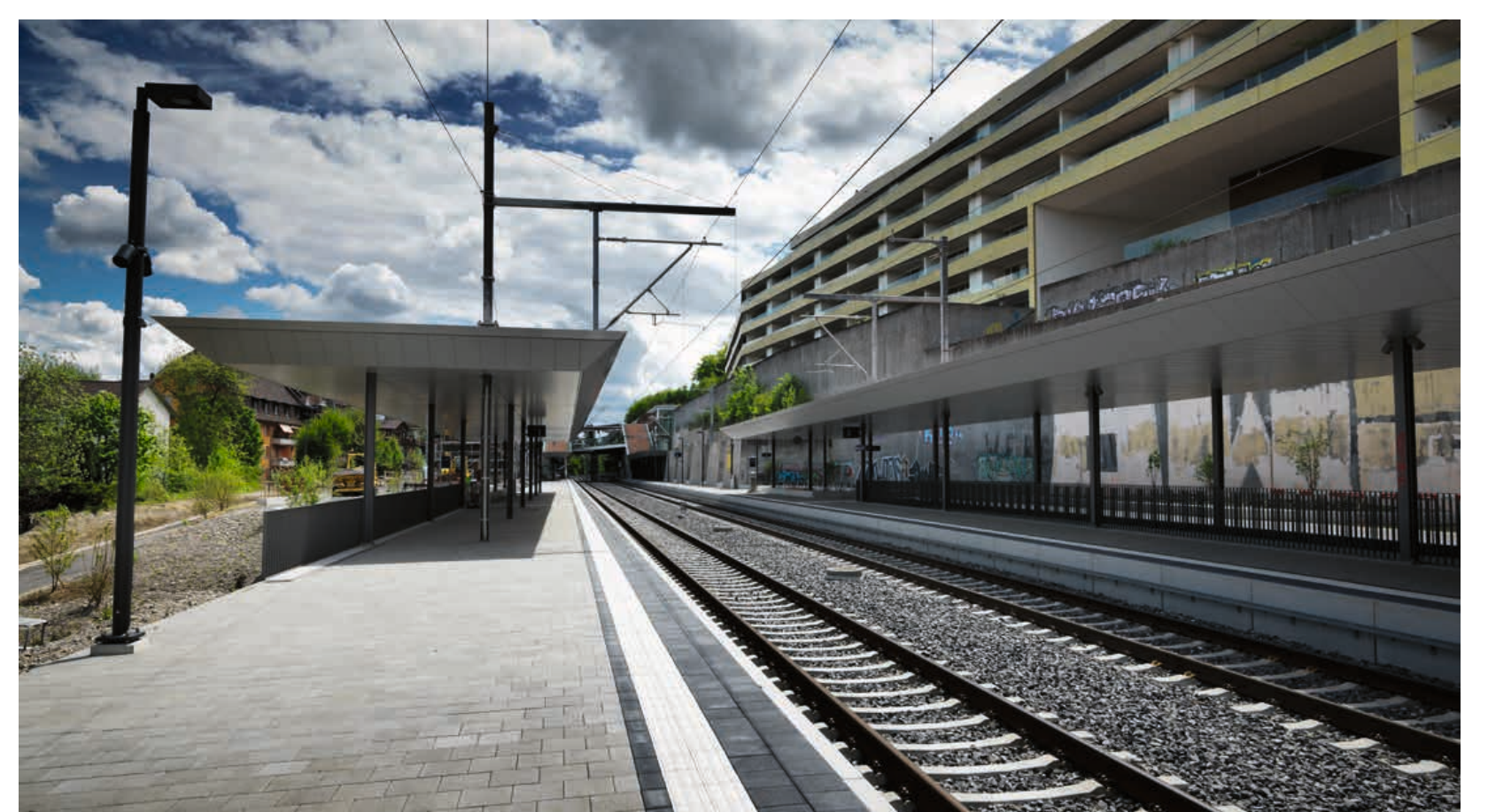
Blick Richtung Thun