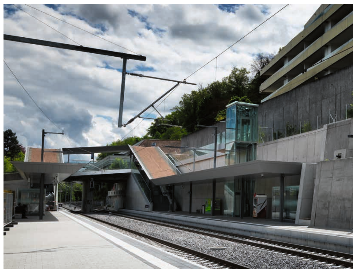
Überführung und Lift