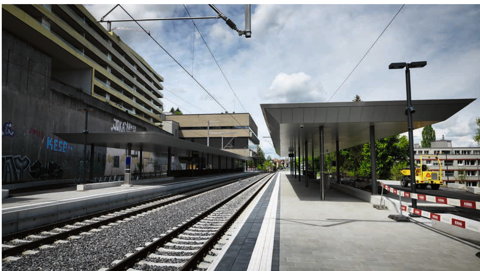
Blick Richtung Bern

BAUHERR: BLS BAUJAHR: 2020 AUFTRAGSVOLUMEN: 360'000 CHF AUFTRAG: Neubau drei neuer Haltestellen, Demontage der kompletten Aussenanlage. Neuinstallation der kompletten Beleuchtung, Kundeninformation und Uhrenanlage inkl. Kabelzug. Ausrüsten neuer Technikkabinen mit Hauptverteilung inkl. Beleuchtungssteuerung und diversen Kommunikationsracks.