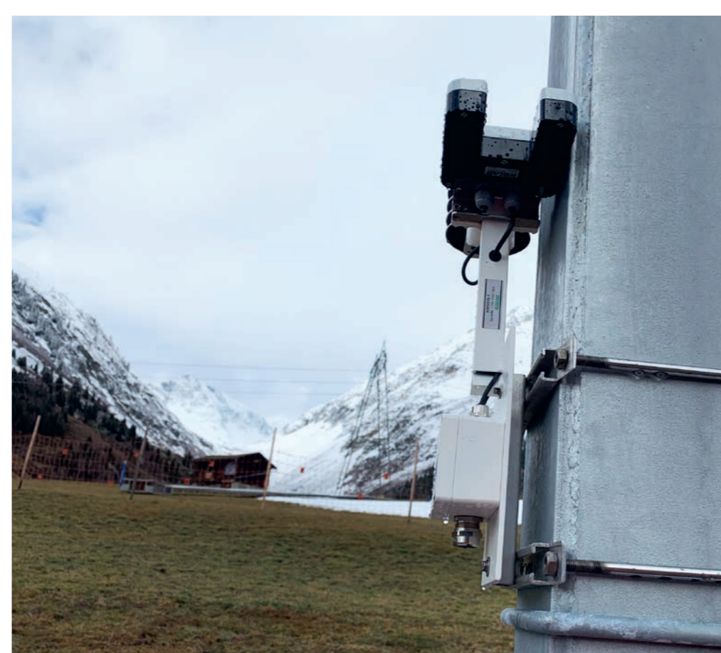
Wetterstation für Weichenheizung