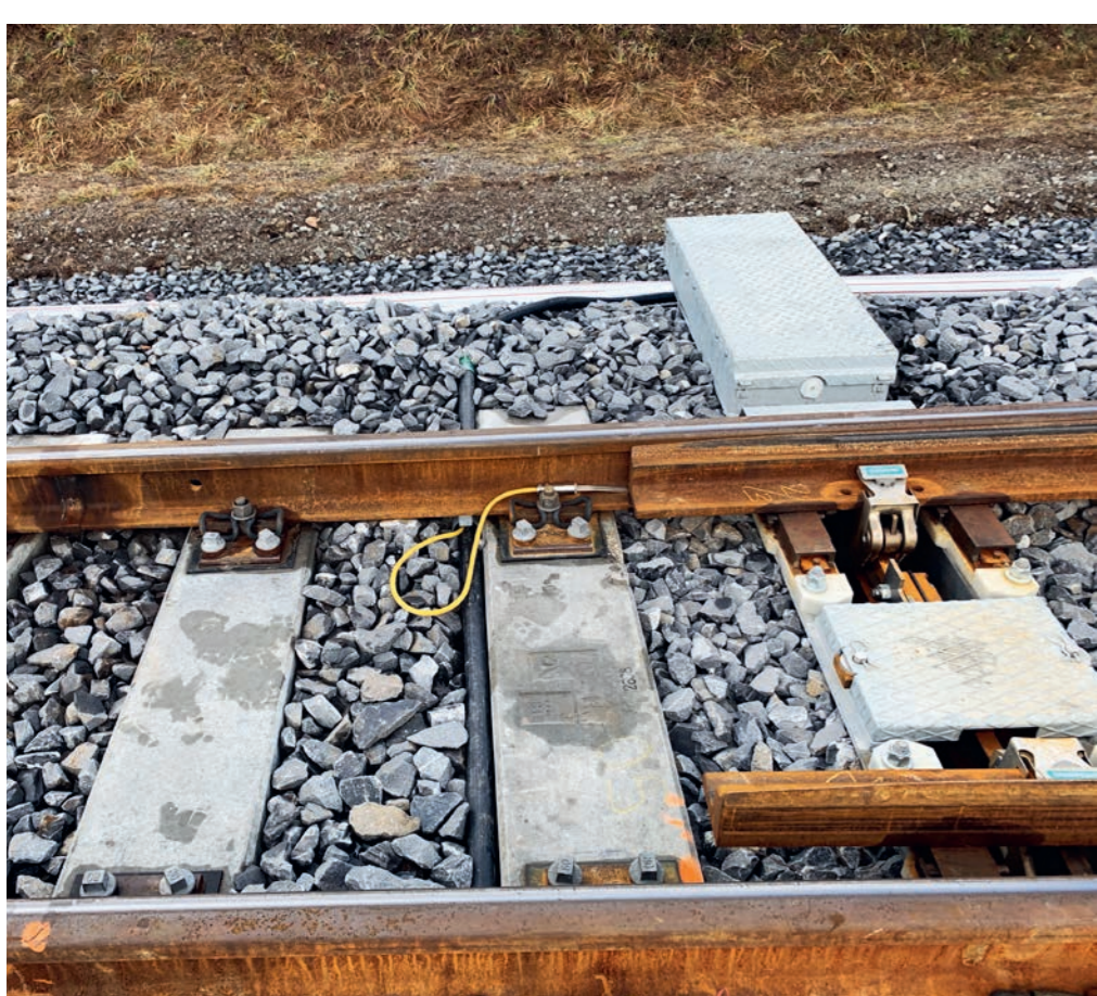
Weiche mit Motor und Heizung