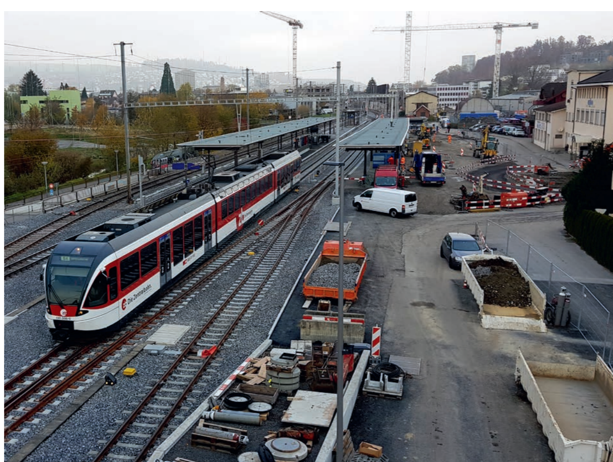
Bahnhof kurz vor Fertigstellung