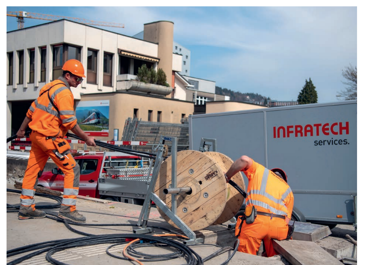
Kabelzug während Totalsperre